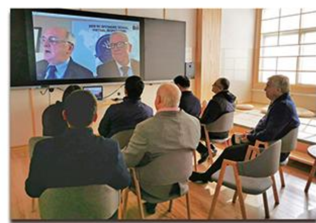
加拿大BC省教育厅督导办学工作