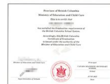
加拿大BC省 Dogwood高中毕业证书

中加班学生均在加拿大BC省教育厅和山东省教育厅注册学籍，满足双方毕业条件可同时获得加拿大和中国两个高中毕业证书。不出泰安就能享受世界一流的北美高中生活，体验原汁原味的加拿大高中教育。