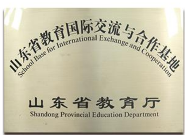
山东省教育国际交流与合作基地