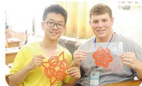
接待汉语桥美国学生夏令营