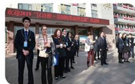
接待“汉语桥”美国校长团