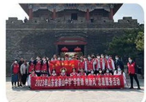
岱庙景区志愿服务