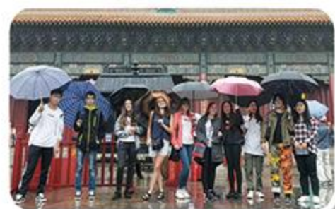
波兰友好学校访问