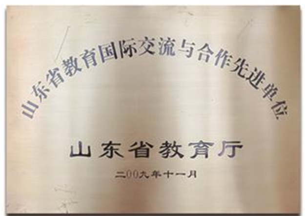
山东省教育国际交流与合作先进单位