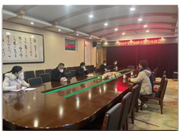
中加班中、加方负责人座谈会