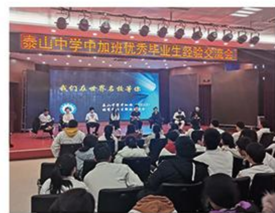
优秀毕业生经验交流会

学生在国内享受到以人为本的北美优质高中教育，不用高考就可以进入加拿大、英国、美国、澳大利亚、中国香港等国家和地区的知名大学学习，近三届中加班毕业生世界排名前100位的大学录取率均在80%以上。