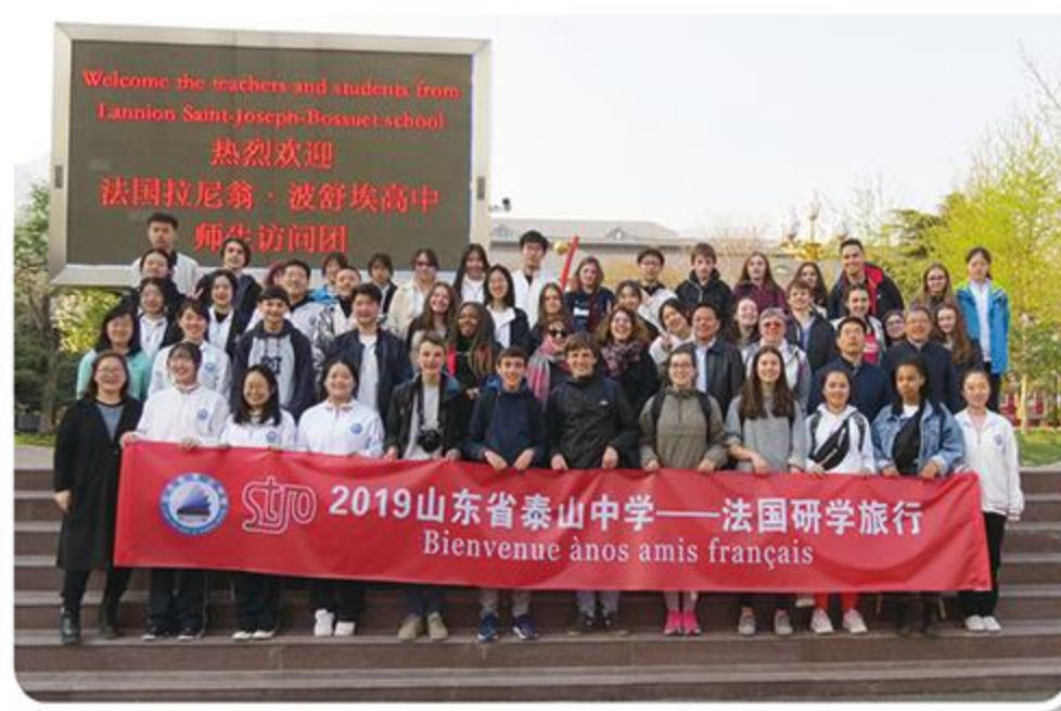
与法国友好学校交流互访

中加班学生自主创办了日语俱乐部、商业领导力社团等，结合课程内容积极组织市场日、圆周率日等多种形式的课余活动。学生们积极开展爱心义卖、志愿帮扶、黄金周志愿服务等公益活动，增强了社会责任感。就读期间学生还有机会参与“汉语桥”中美校长论坛、国际教育展等大型国际教育交流活动，还有机会走出国门，赴加拿大、法国、日本等学校进行访问学习。