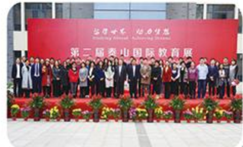
举办泰山国际教育展