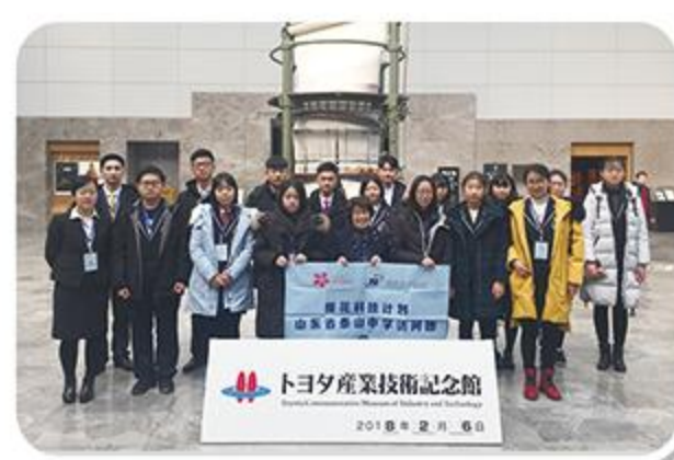
日本樱花科技计划交流