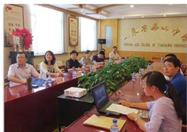
省教育厅领导来校调研中加班