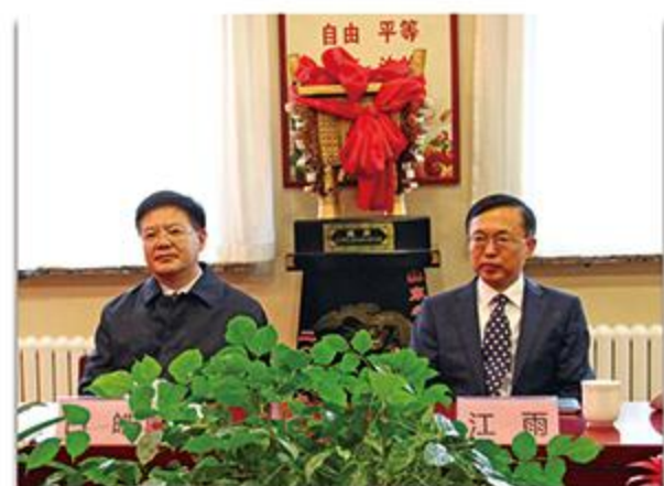
省教育厅领导出席我校中外合作办学研讨会

山东省泰山中学因突出的教育对外交流与合作成绩，先后荣获首批全国汉语国际推广基地学校、山东省教育交流与合作先进单位、山东省首批基础教育国际化建设学校等多项荣誉称号。