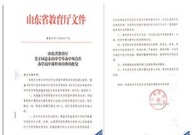
山东省教育厅文件